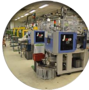
Injection Plastique (27 M/c)