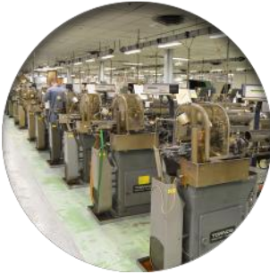
Décolletage (82 M/c)