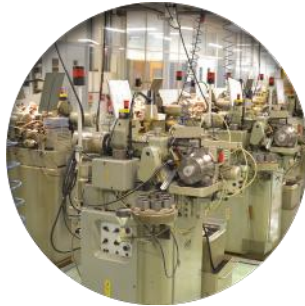
Taillage (55 M/c)