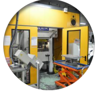
Découpage (10 M/c)